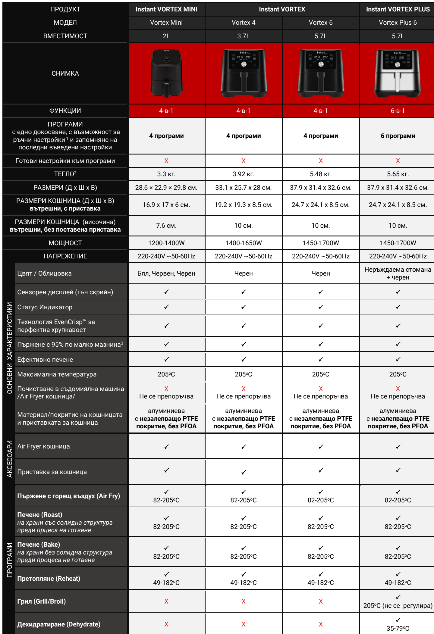
Сравнителна таблица на характеристиките на еър фрайъри Instant