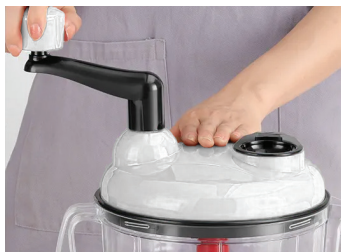
2. Заклучете капака и завъртете ръкохватката