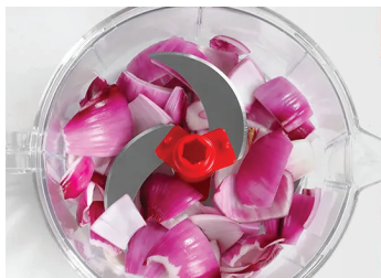
1. Поставете острието и храната в купата