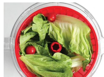
3. Отцедена салата без чакане

В комплекта са включени още Приставка за разбъркване и Разделител за яйца .