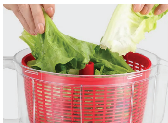
1. Поставете кошницата и зеленчуците в купата