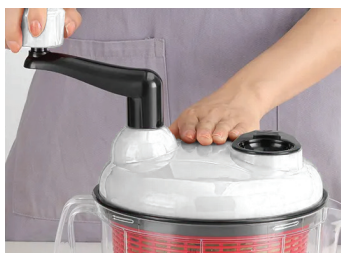
2. Заклучете капака и завъртете ръкохватката