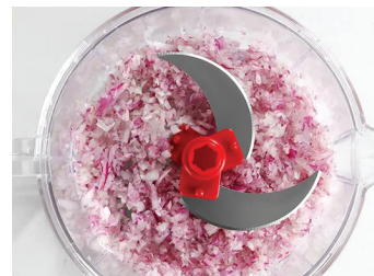
3. Лук, нарязан без сълзи