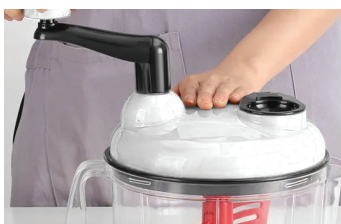
2. Заклучете капака и завъртете ръкохватката