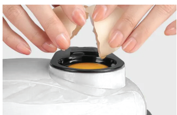
1. Поставете приставката за разбъркване и яйцата

В комплекта са включени още Приставка за разбъркване и Разделител за яйца .